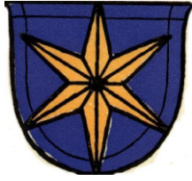
E.E. Zunft zum Goldenen Stern