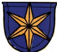
E.E. Zunft zum Goldenen Stern